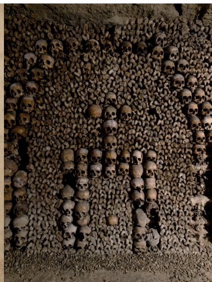
Les Catacombes