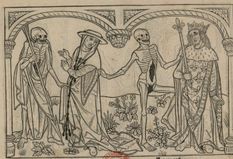
Danse macabre, Paris, Guy Marchant, 1485 © Grenoble, BM, I.327 Rés