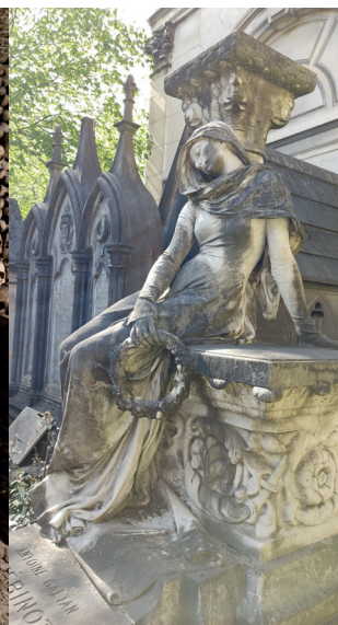
Cimetière du Père-Lachaise