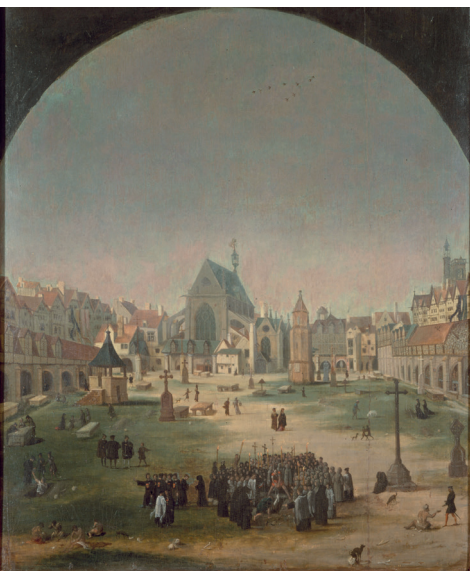
Anonyme, Vue du cimetière des Saints-Innocents, XVI e siècle